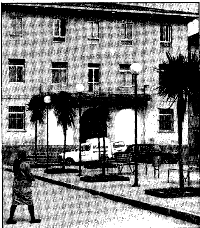
La idea del seminario partió de la comisión municipal de cultura.