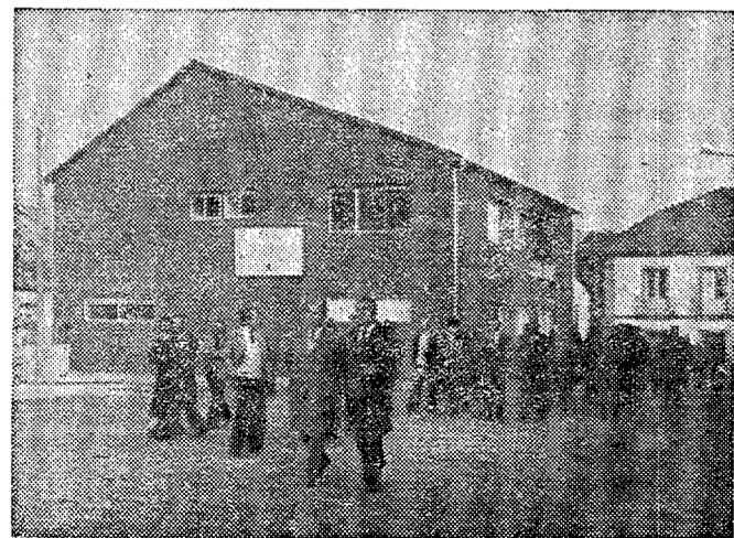
En La Baña, el gobernador civil, acompañado por el alcalde de la localidad, inauguró el Centro de Higiene Rural.