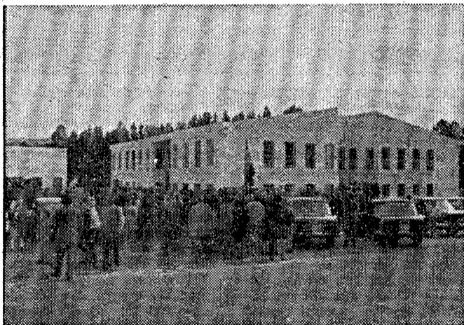
Aspecto parcial del Colegio Nacional de Zas, inaugurado ayer por el gobernador civil de la provincia

realizarse como un paso adelante más que permitirá al municipio mantener la esperanza de un futuro prometedor. Destacó el proyecto de afirmar los caminos de la Concentración Parcelaria, que absorberá un presupuesto de once millones de pesetas; la carretera de La Piolla, subastada el pasado día 12 en una cantidad cercana a los diez millones de pesetas; los caminos de Ventoselo y de Romelle, y ofreció cien mil pesetas al Ayuntamiento para cualquier necesidad urgente. Comunicó a los vecinos que está en estudio la nueva Ley de Electrificación Rural que solucionará las deficiencias existentes, y respecto al problema de los teléfonos prometió su colaboración en las gestiones de solicitud. «Es necesario —afirmó— que los vecinos complementen la ayuda del Estado. Existen unas obras que nos permiten ser optimistas y por ello os llamo a la solidaridad para que Zas pueda