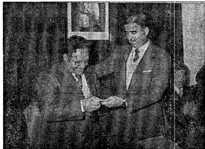
El alcalde de Bembibre recibe de manos del gobernador civil varias subvenciones concedidas por el IRYDA al Valle del Dubra.