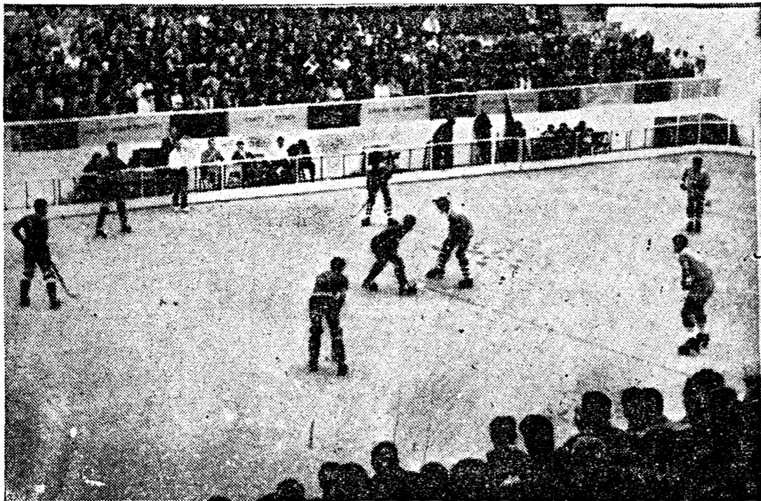
Una fase del partido Villanueva - Femsa, primero de los dos disputados en la tarde de ayer, en el Estadio de Riazor.

La organización ha sido digna de todo elogio, demostrando nuestros federativos de la misma que saben como y cuando tienen que hacer las cosas y tomar determinaciones en or-